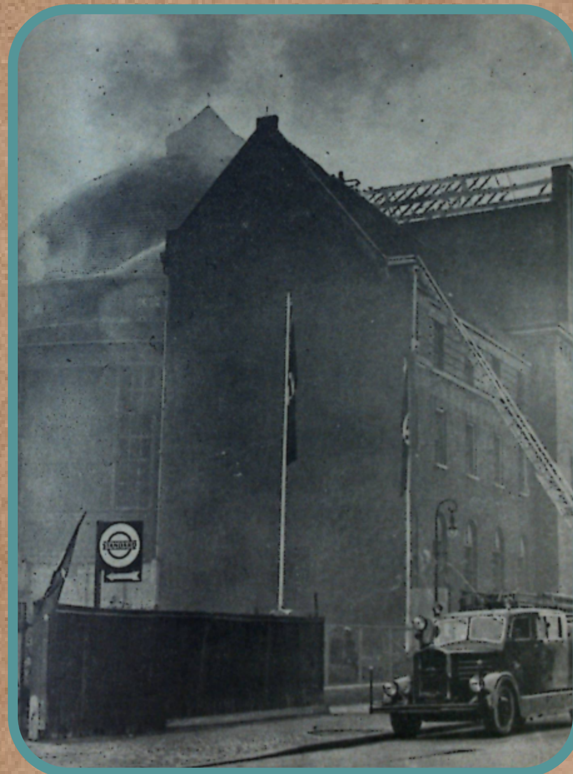
בית הכנסת בברלין