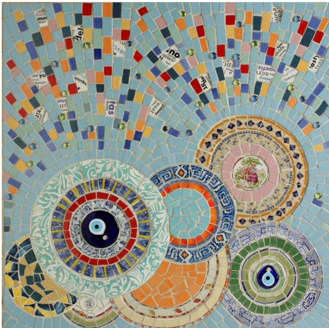
”חמניות”, 90x90 סמ