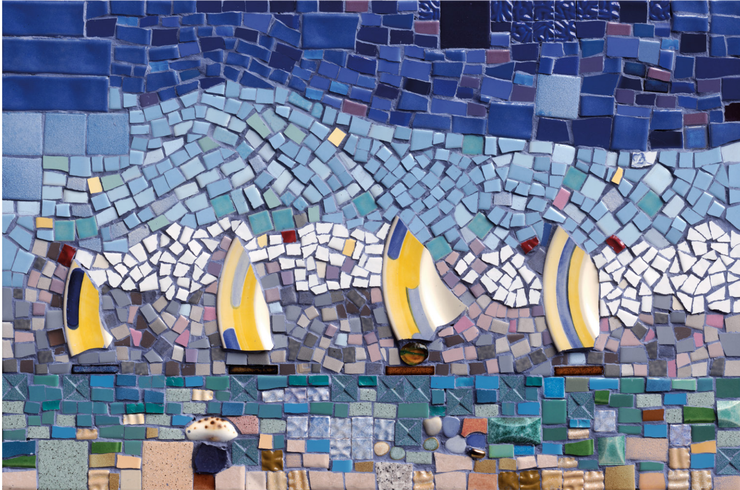
”סירות”, פסיפס, 70x50 סמ