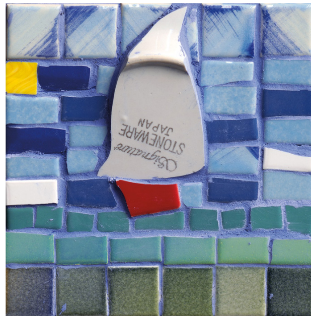
"סירות", פסיפס, 10x10 סמ