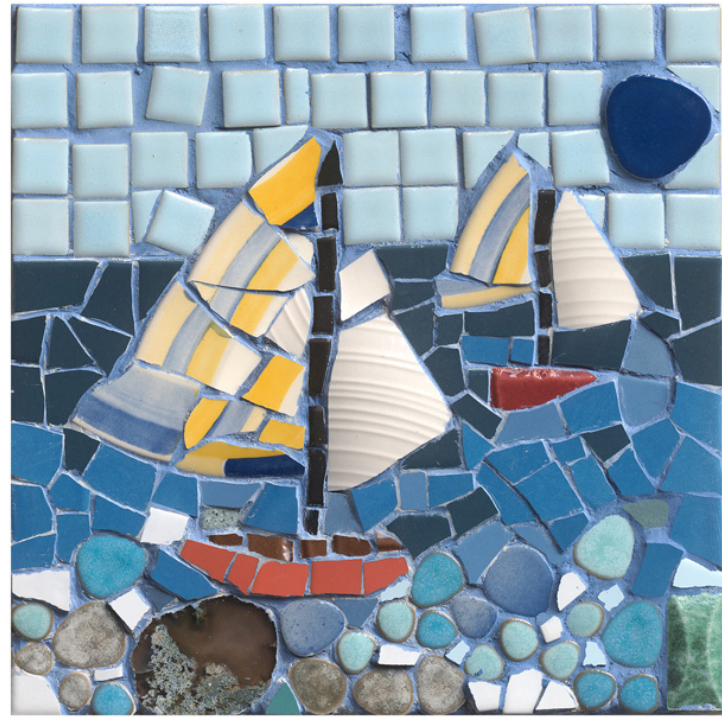
"סירות", פסיפס, 30x30 סמ