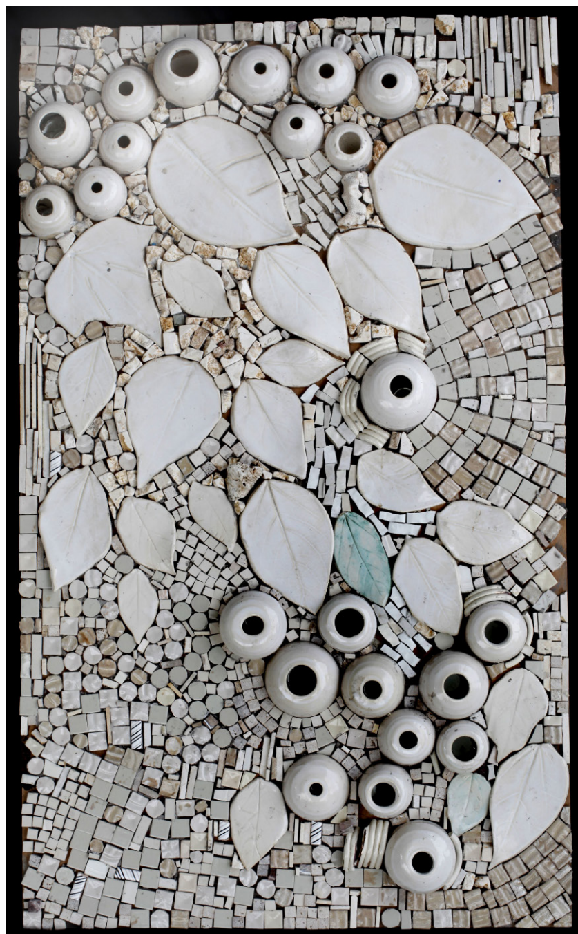
"מונוכרום", מיקס מדיה, 100x60 סמ