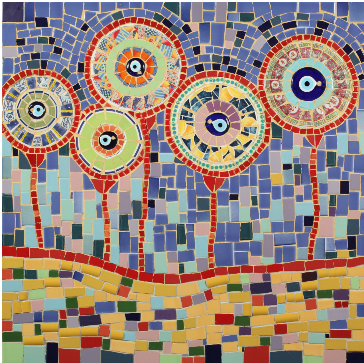
”חמניות”, 90x90 סמ