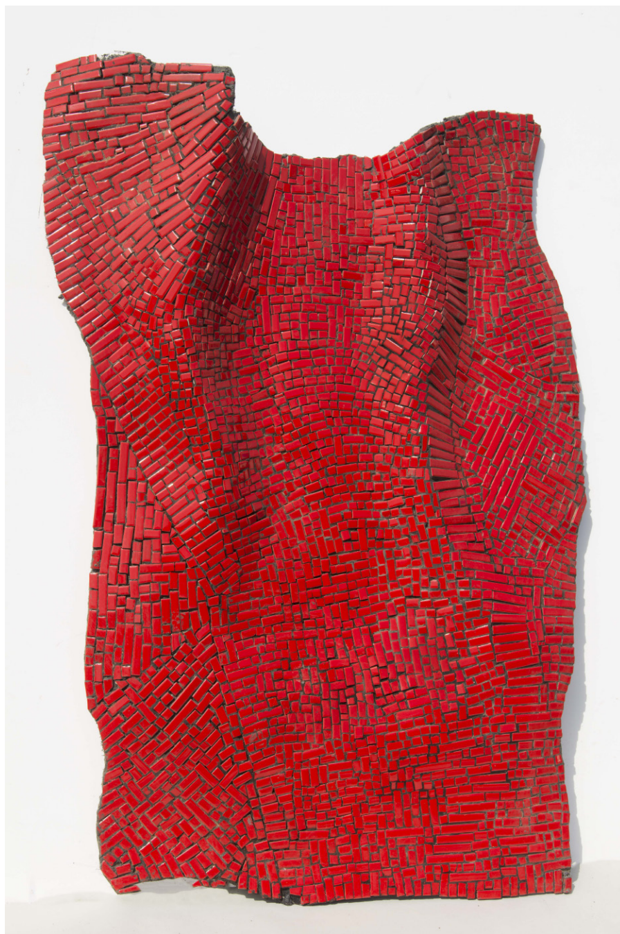
"גוף", מוזיאקה, 100x57 סמ