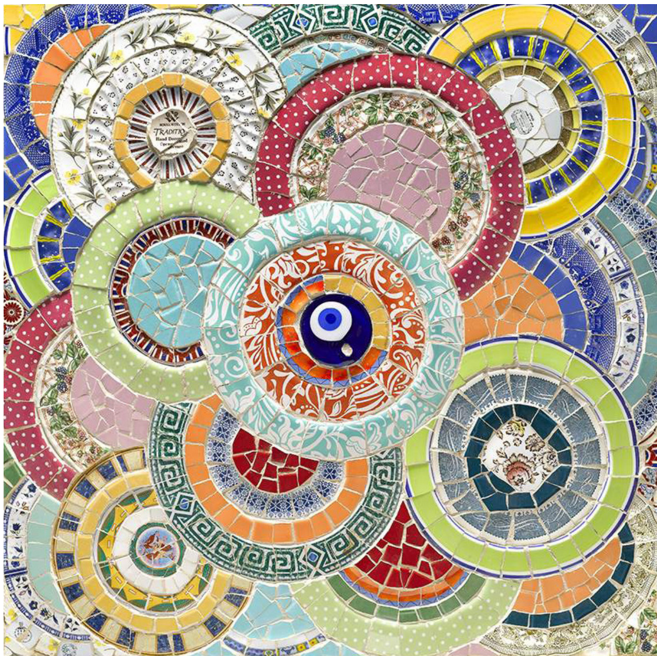
"חמניות", 90x90 סמ