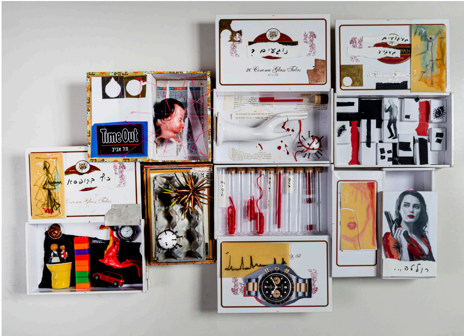
”טיים אין טיים אווט”, 2021