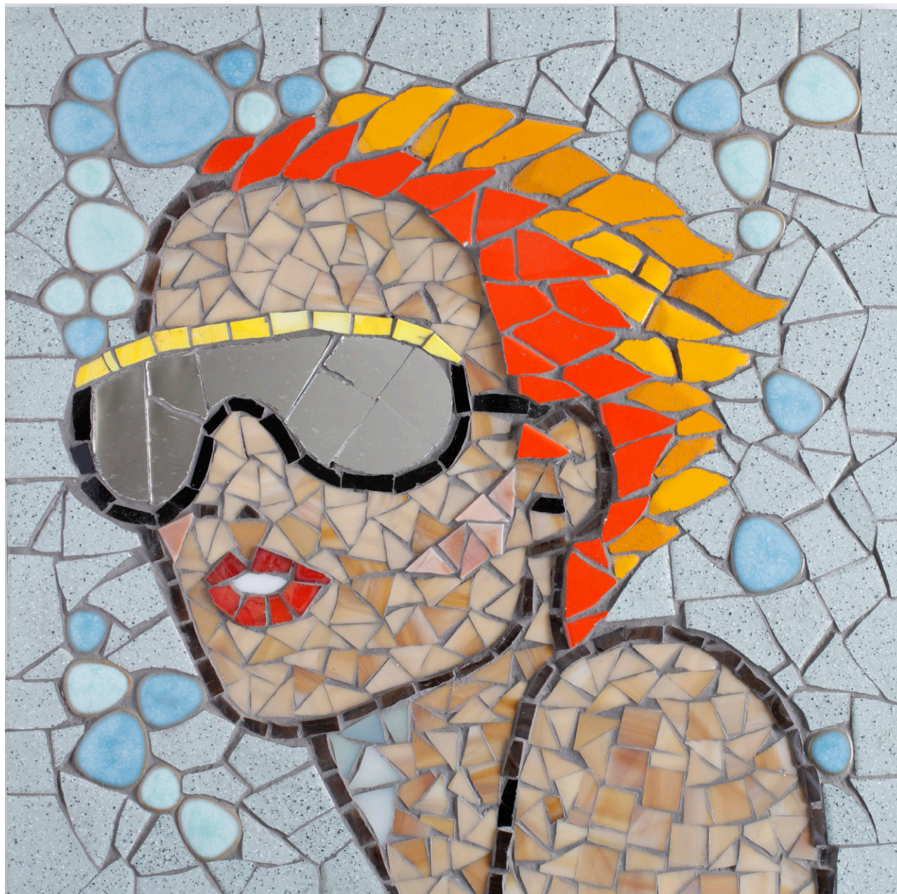
"מסכות", פסיפס, 30x30 סמ