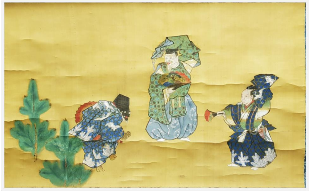
*התמונה מתוך: אוסף אומנות שגן