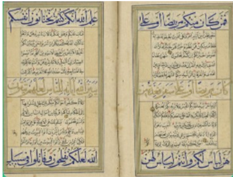
*קוראן מעוטר מתחילת המאה ה-16 באיראן. מתוך: אתר הספרייה הלאומית

בדף יש גם תצוגה וירטואלית של ספרי קוראן נדירים מאוסף הספרייה, חידונים על עולם האסלאם ופלייליסט מוזיקלי! פרויקט מושקע ומגוון שכדאי להכיר. זמן רמדאן בספרייה הלאומית