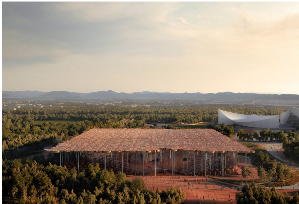
הספרייה בבייג'ינג

בספר עצמו ניתן למצוא מאמרים נוספים הנוגעים למידענות והספריות האקדמיות, אתגרים סביב נגישות למידע, פרסום וזכויות יוצרים והוא פותח צוהר לדיון בנושא.